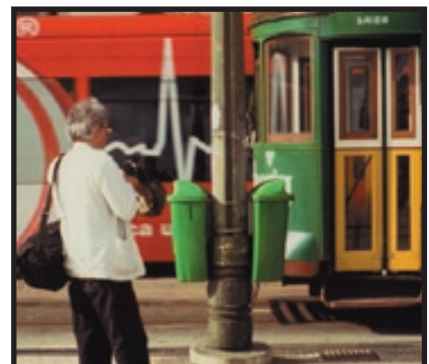
V. Blanchet en tournage avec la Neuville au Portugal, 2003