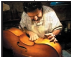
« De l'Arbre au Violon »