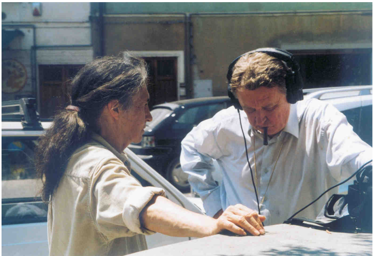
Danièle Huillet et Jean-Marie Straub

C'est en 1962, huit ans après s'être rencontrés, que Danièle Huillet et Jean-Marie Straub tournent leur premier film, « Machorka-Muff ». Jusqu'à la disparition de Danièle Huillet, en octobre 2006, ils furent unis en un compagnonnage indéfectible par leur pensée résolue, leur incessant questionnement, leur refus des modes et leur foi dans le regard et l'intelligence des spectateurs. Cinéma exigeant ? Evidemment, mais de cette exigence qui devrait être l'oxygène de tous, cinéastes ou pas. Cinéma difficile ? Certainement pas. Ce cinéma est un cinéma des sens. Il décille, il aide à voir.